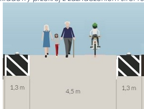
Rysunek 1. Przykładowy przekrój z zaznaczeniem stref ruchu na kładce 4 .