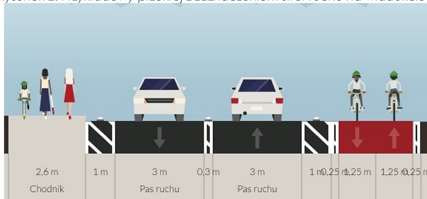
Rysunek 2. Przykładowy przekrój z zaznaczeniem stref ruchu na wiadukcie 5 .